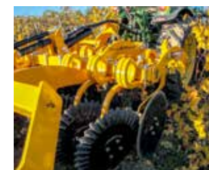
Les déchaumeurs à disques Disc-O-Vigne permettent d'entrer dans le sol sur une dizaine de centimètres.