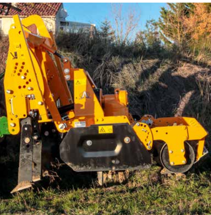
L'ameublisseur Combivigne peut travailler dans des vignes ayant un écartement inter-rang de 1,20 à 2,20 mètres. Il est ici associé à une herse rotative Agrisem.

Prix : à partir de 3 950 € HT pour le Cultivigne 1,20 m, rouleau à cage Ø 400 mm compris